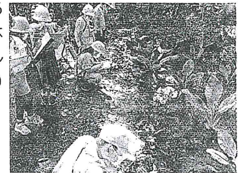
イチリンソウ(一輪草)→

「安行のすてき発見!」として、自分たちが住む安行の自然に触れたり訪れたりする体験的な学習を行っています。体験活動を通して安行のすてきな所をたくさん発見し、より川口市を好きになってほしいと思います。